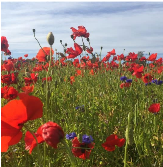
Ängen vid Kajen i Mora.

Naturskyddsföreningen har drygt 550 medlemmar i Mora och ca 220 000 i landet. Bli medlem du med! natskyddsforeningen.se/blimedlem , 08-702 65 00