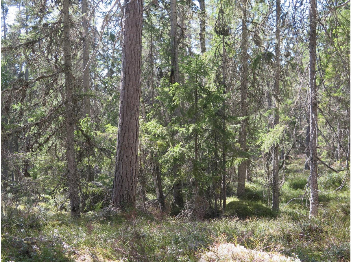
Den här bilden är tagen i området och visar en skiktad olikåldrig naturskog som ska avverkas i sin helhet.